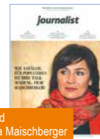
Mitglied Sandra Maischberger Moderatorin ARD

Unsere Mitglieder erhalten regelmäßig die Verbandszeitschrift »journalist«. Elektronisch versenden wir Informati-onen und Veranstaltungseinladungen sowie den wöchentlichen Newsletter des DJV-Bundesverbandes.